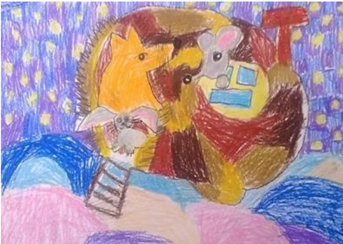
Иллюстрация к зимней сказке.