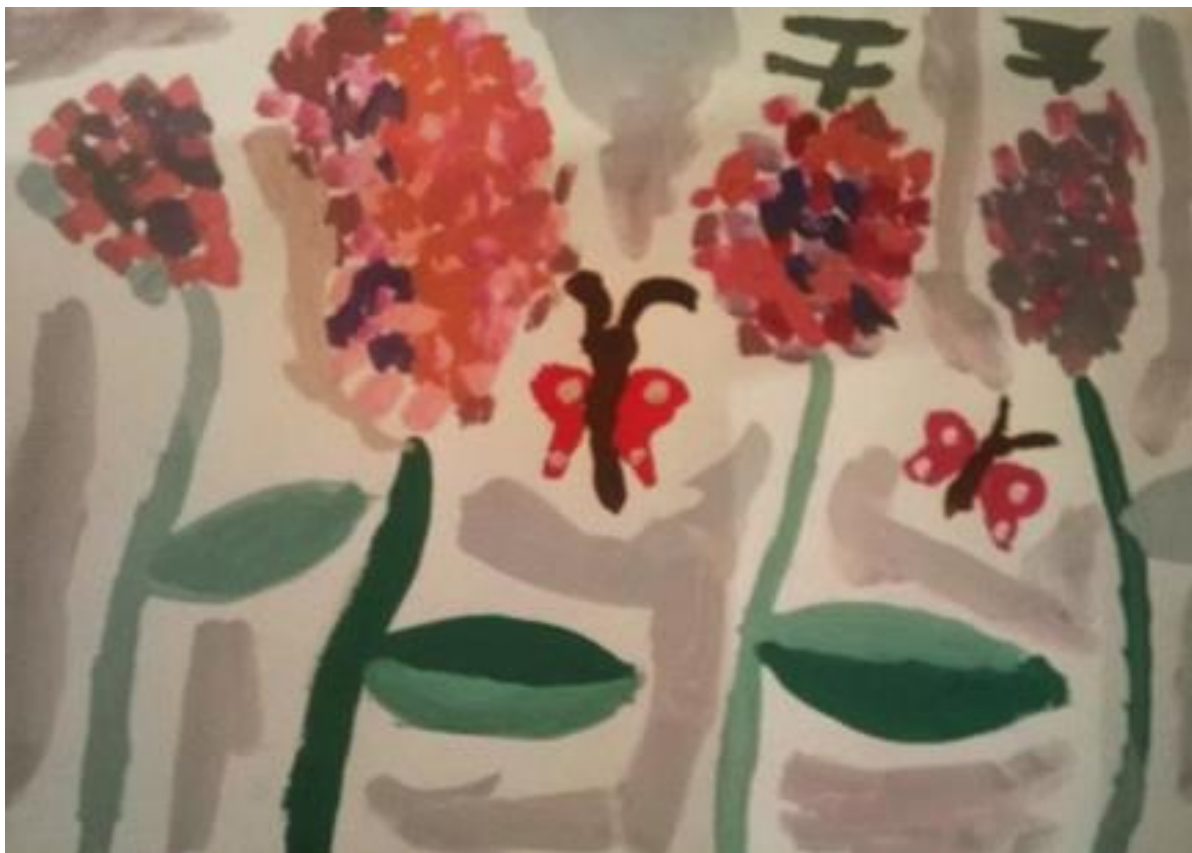
Тема: Воспоминания о лете