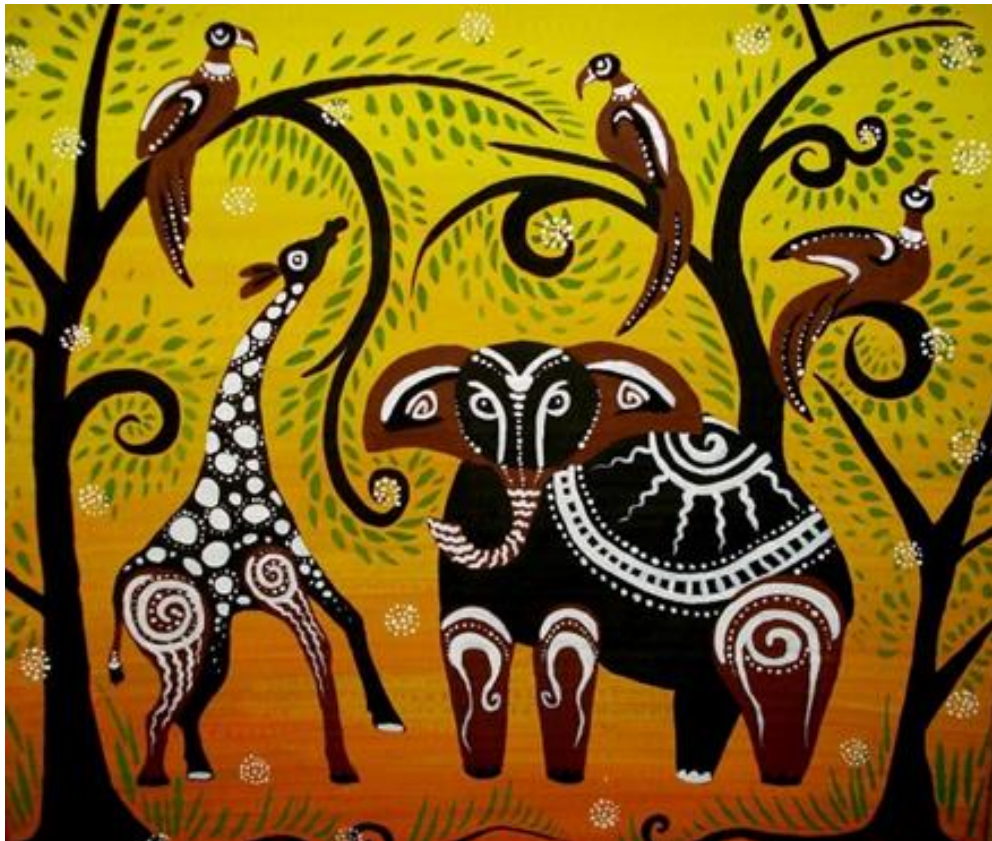
Тематическая композиция «Африка»