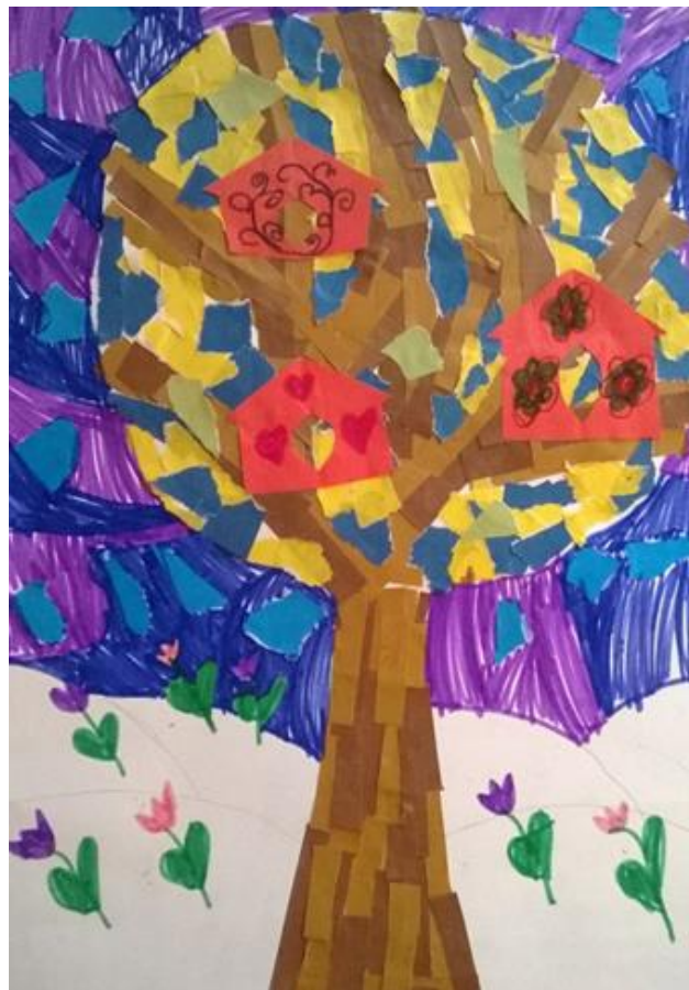
Композиция «Весна пришла»