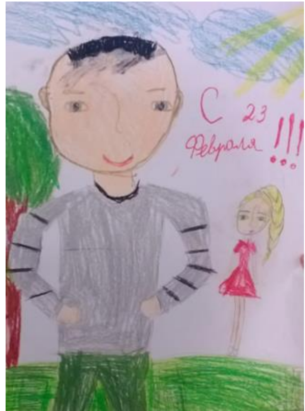
Композиция на тему «Мой папа»