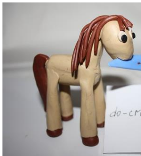
Ферма «Свинка», «Лошадка»