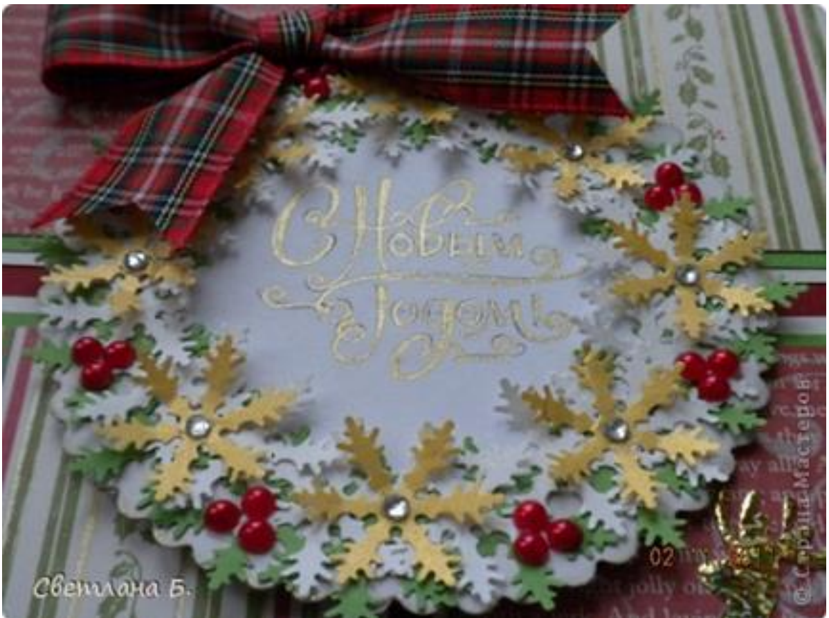
Мастерская Деда Мороза «Новогодняя игрушка-открытка»