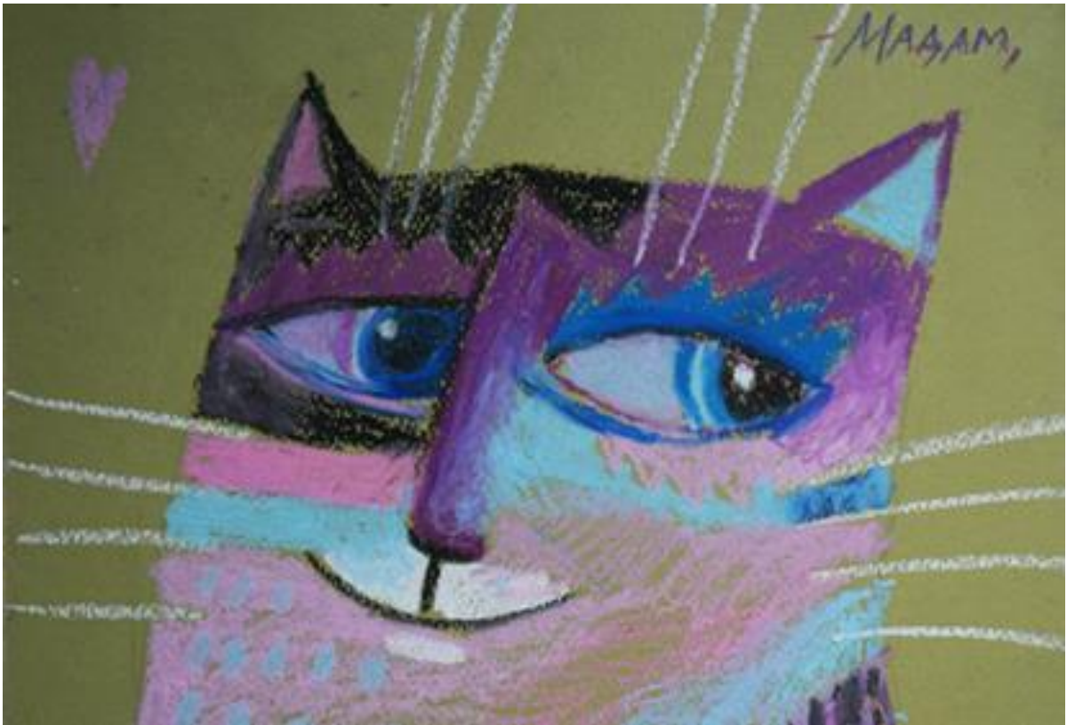
Упражнение «Зимний кот»