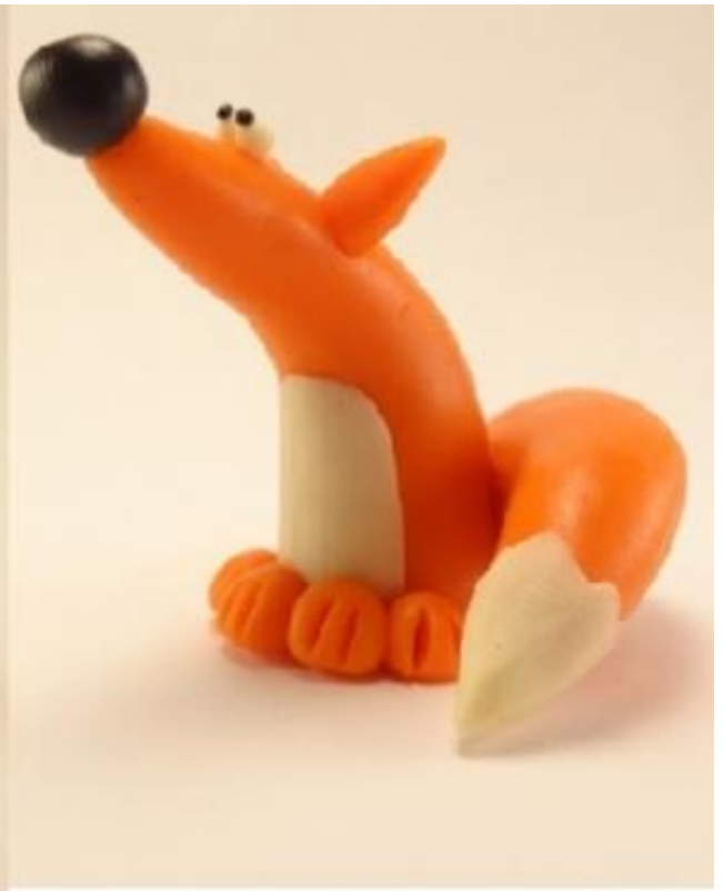
Композиция на тему «Зимний день»