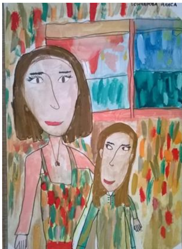
Тематическая композиция на тему «Моя мама» или «Семья»