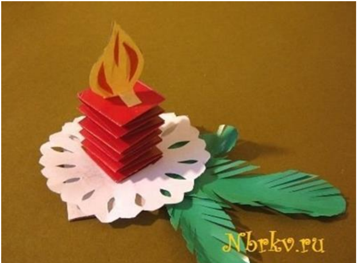
Мастерская Деда Мороза «Свеча»