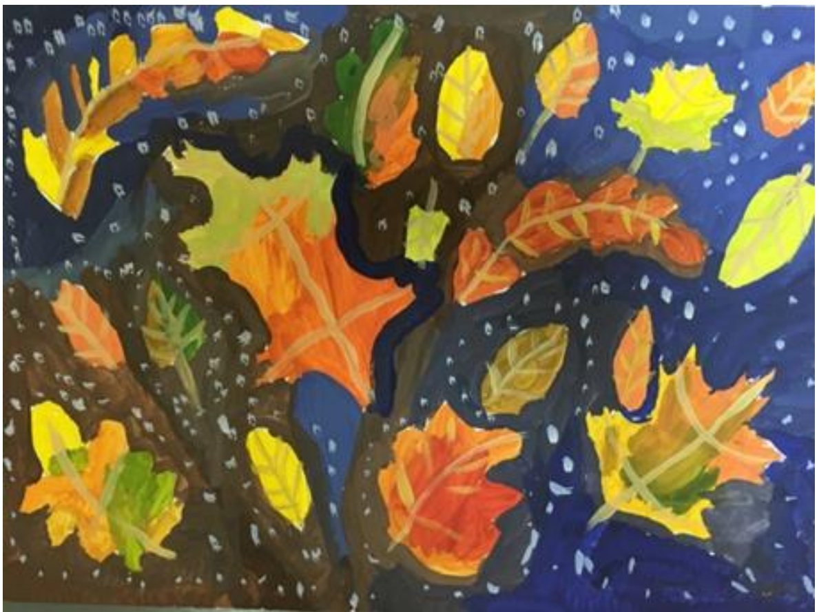
Композиция: Осенний листопад