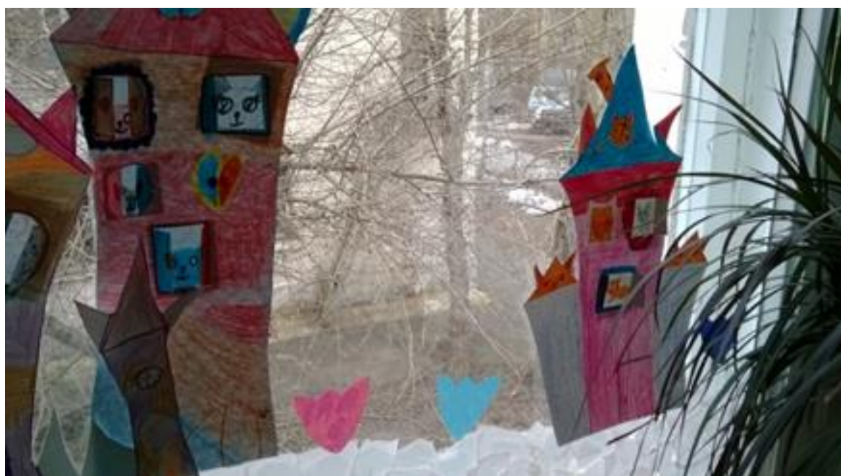
Декоративная композиция «Котодом»