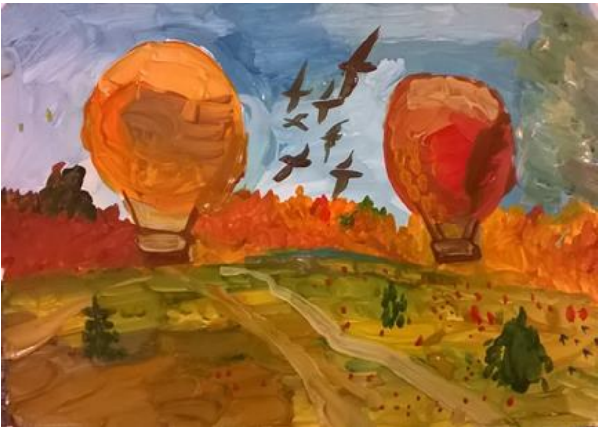
Композиция: Осенний лес