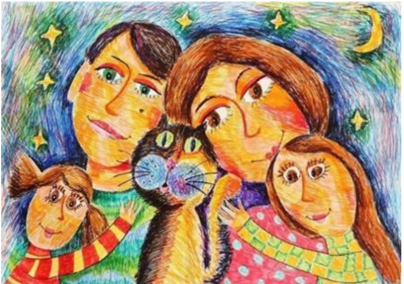
Тематическая композиция на тему «Моя мама» или «Семья»