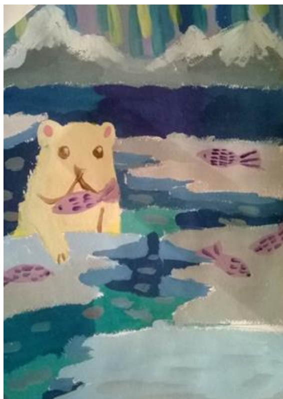
Композиция на тему «Северные жители»