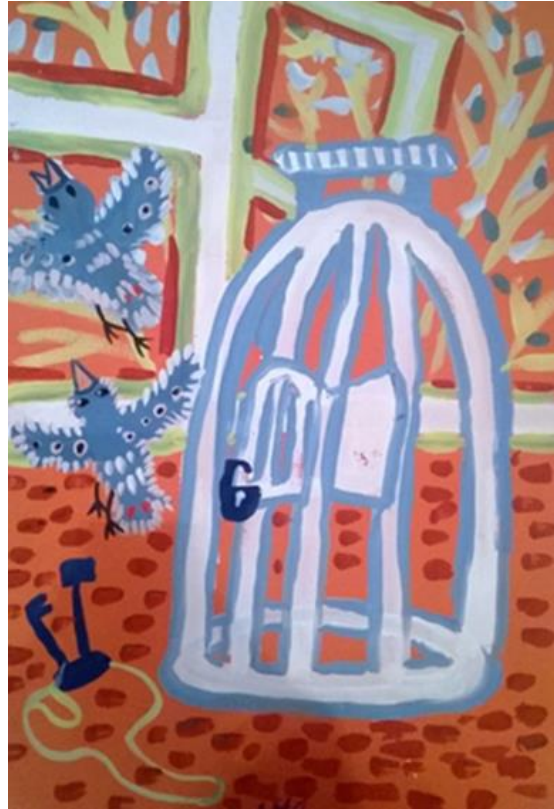
Мастерская Деда Мороза «Новогодняя игрушка-открытка»