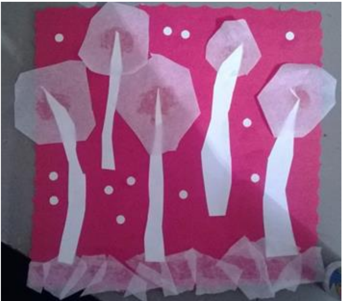
Аппликация «Зимняя пора»