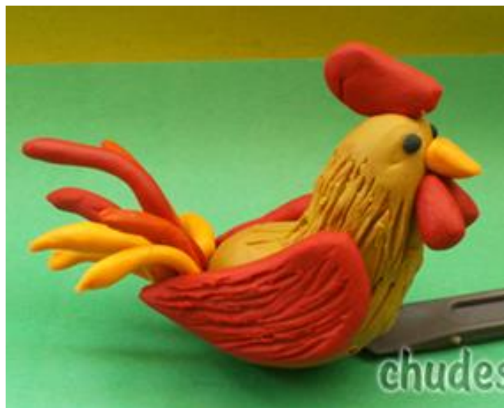
Ферма «Курочка и петушок»