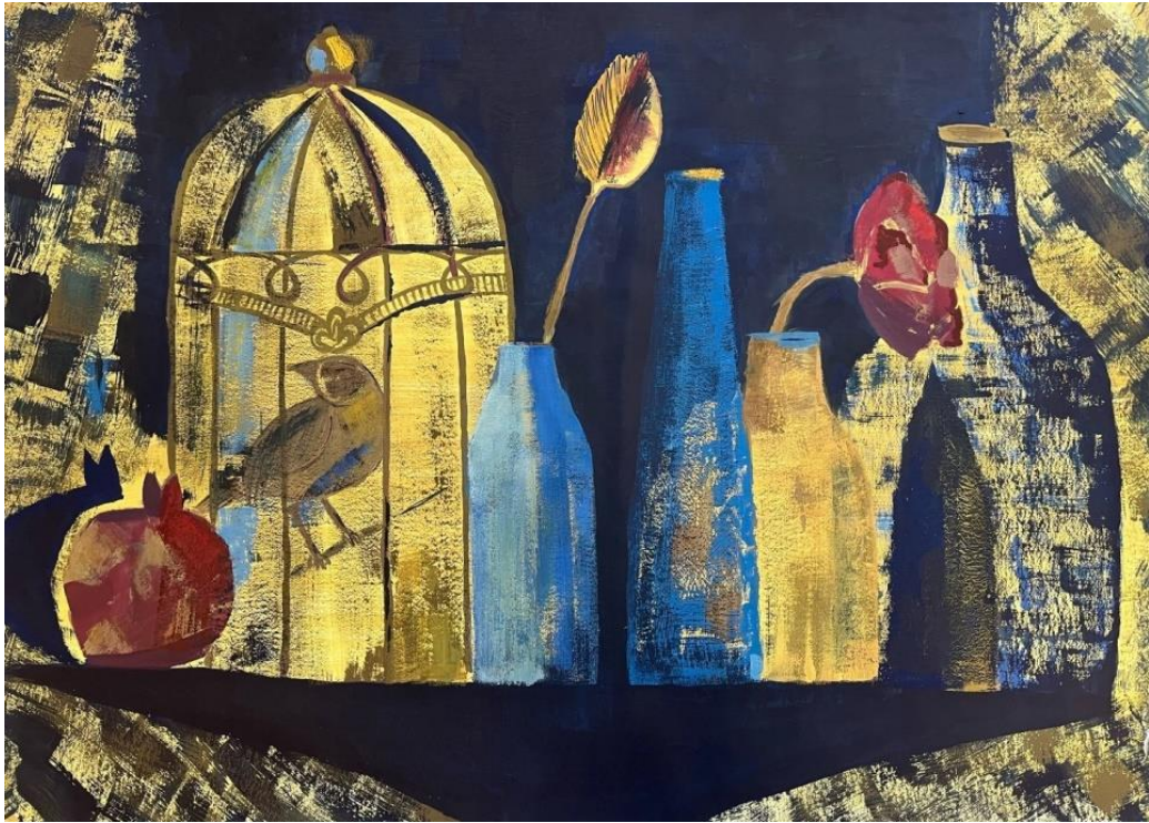
Живопись. Фактуры в натюрморте. Теплохолодность