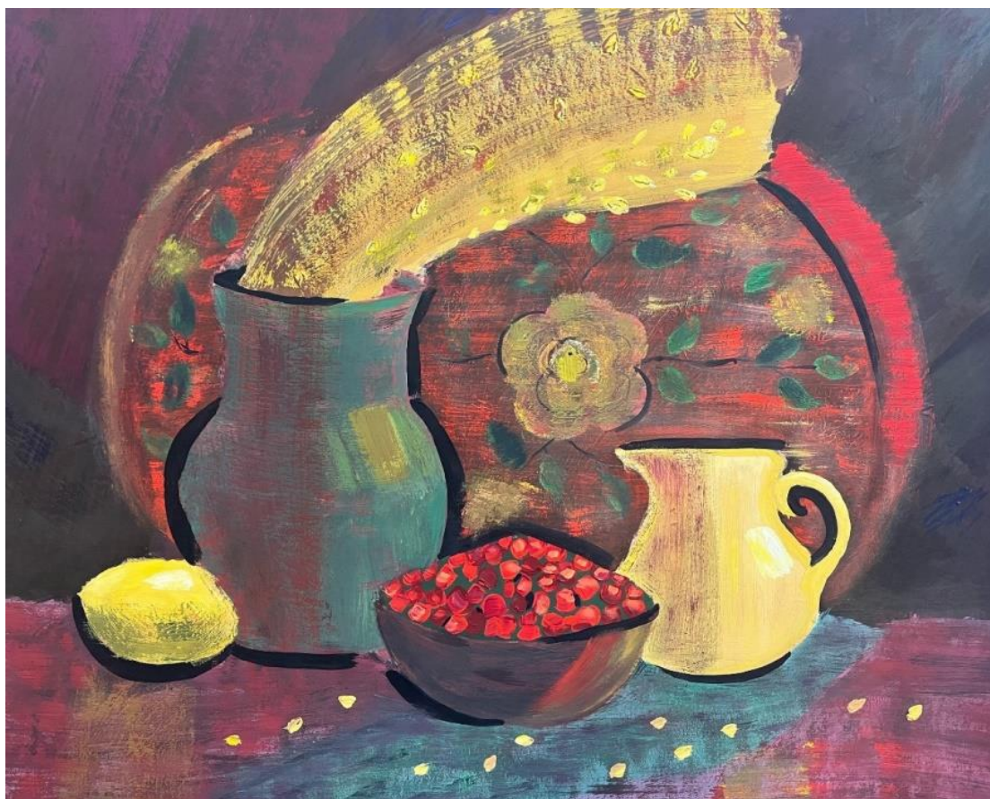
Натюрморт в тёплой цветовой гамме