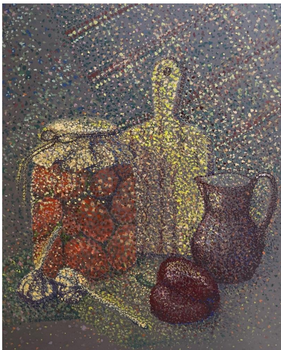
Живопись. Натюрморт в стиле пуантилизм