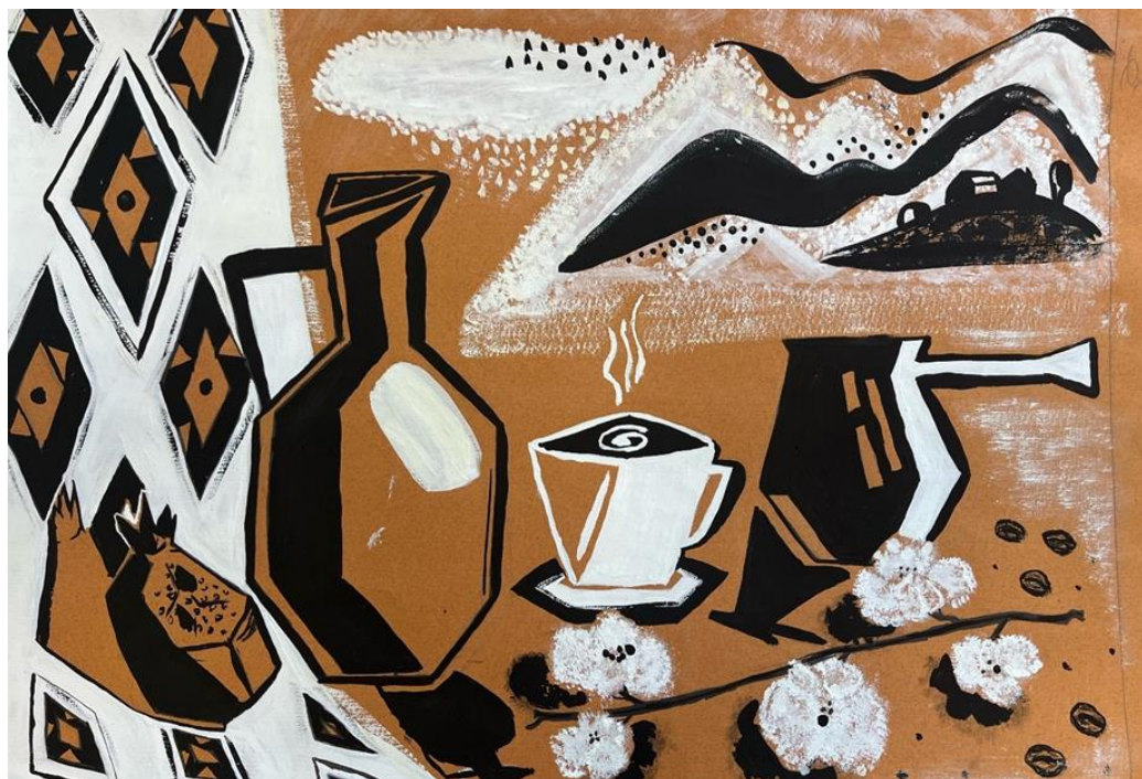
Графика. Натюрморт на тонированной бумаге