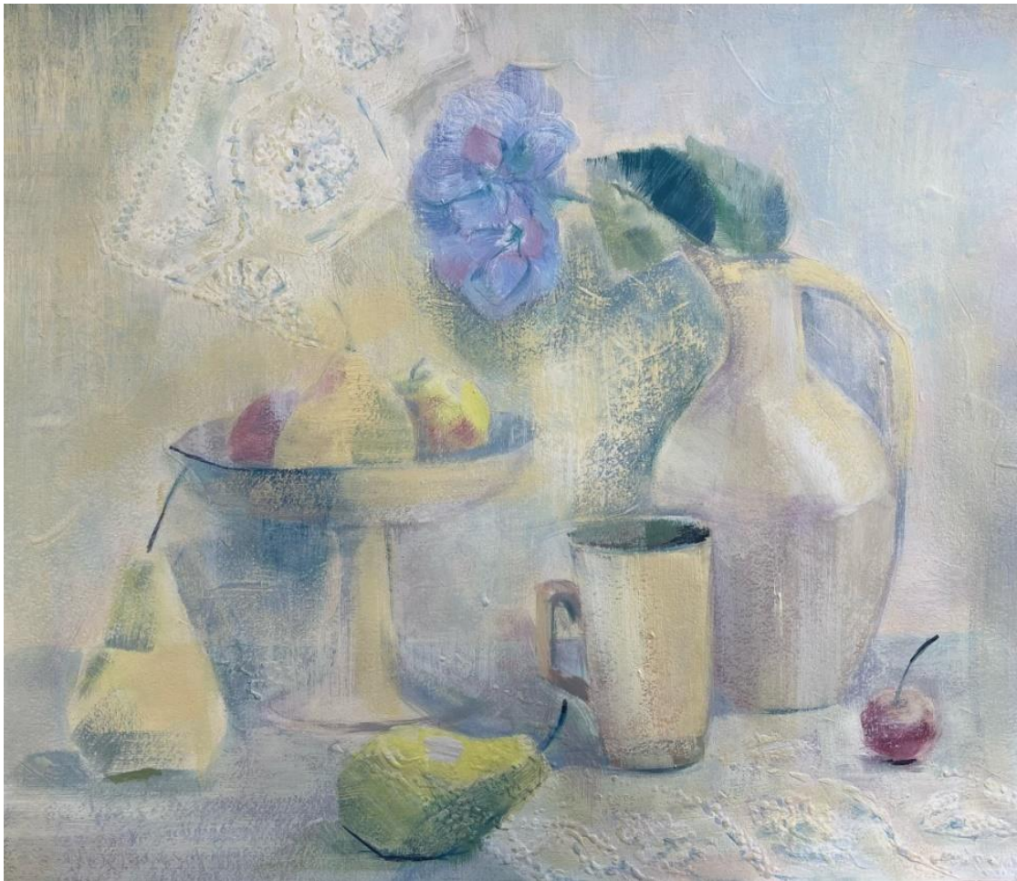
Живопись. Светлый натюрморт. Нюанс в работе