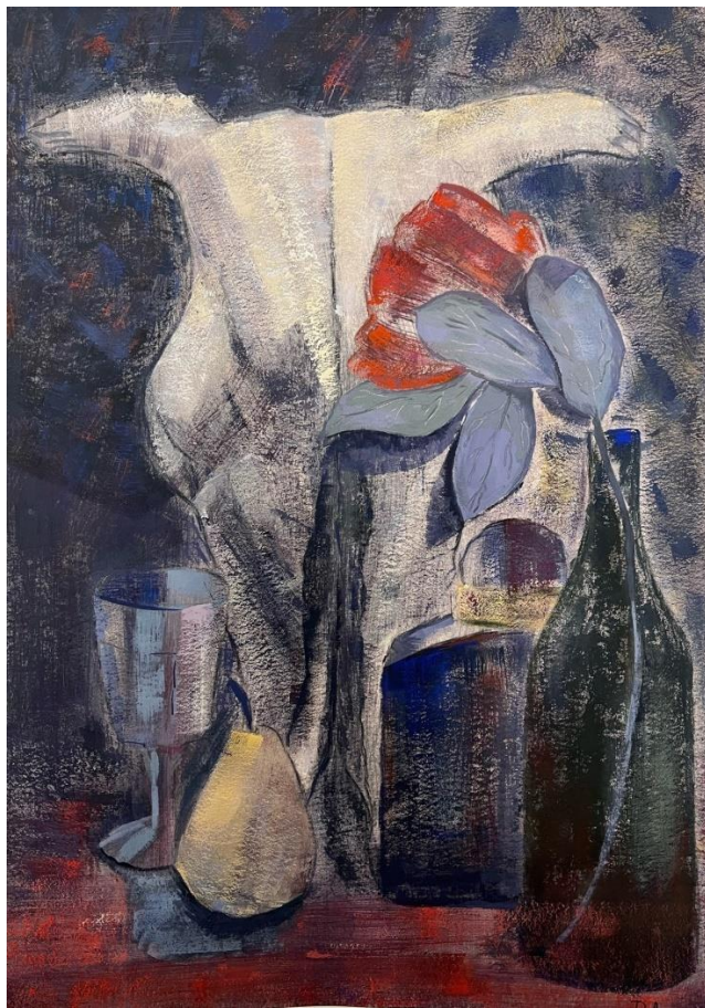
Живопись. Натюрморт на глубоких цветовых отношениях