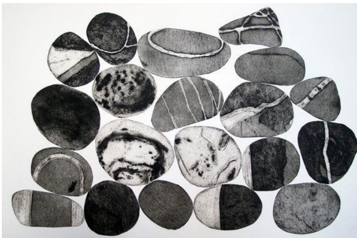
Смешанная техника «Сад камней»