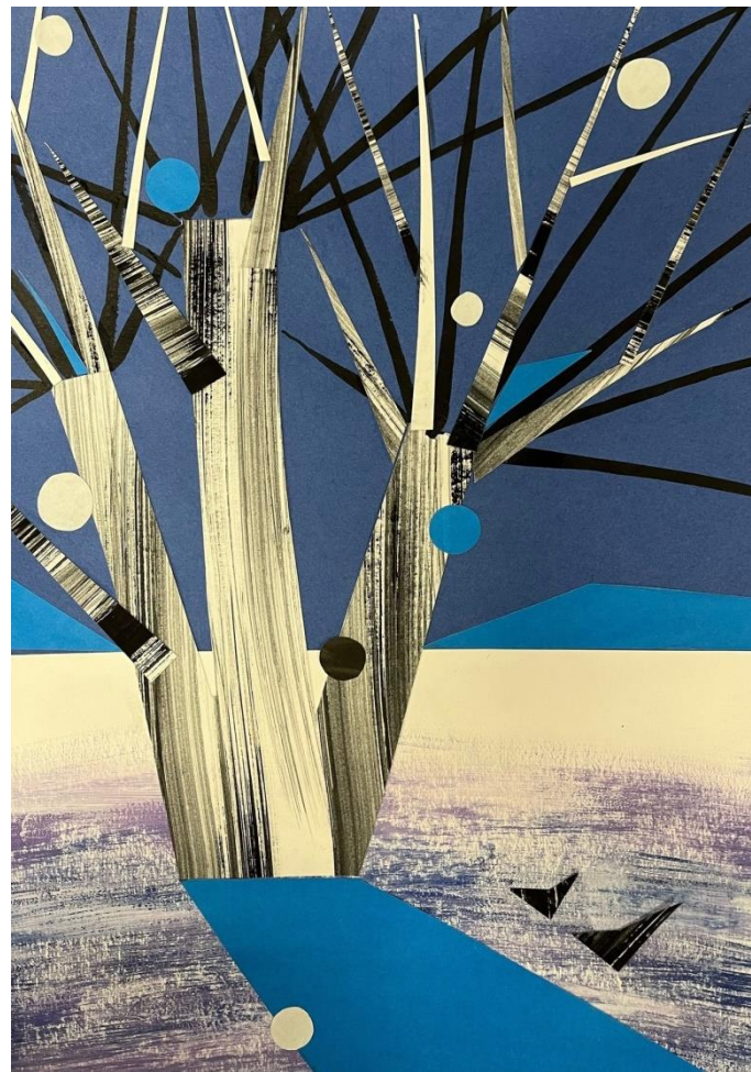
Рис.8 Коллаж «Моё дерево»